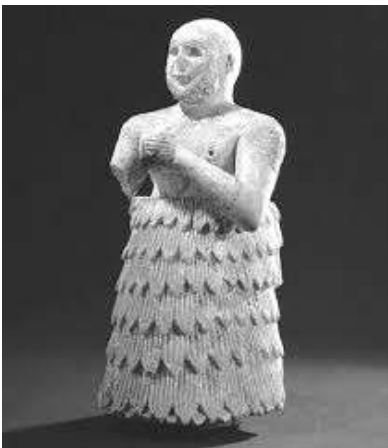
"Statuette votive en albâtre", Assur, - 2 400, H 46 cm, Vorderasiatisches Museum - SMB, Berlin.

J'invite les personnes intéressées par la problématique des œuvres d'art spoliées dans ces régions victimes de pillages et de trafics illicites à consulter le site officiel de l'ICOM (Conseil International des Musées), où sont disponibles les LISTES ROUGES des œuvres en péril dans divers pays dont la Syrie, l'Irak, la Lybie :